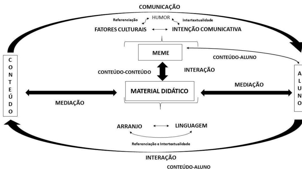
Figura 4: Perspectivas para a utilização do meme em MD