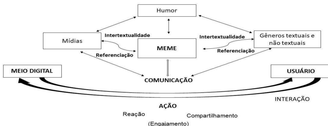
Figura 2: Comunicação do meme em ambientes digitais

Podemos perceber o meme como uma manifestação linguística referenciada por outros textos através do humor, elemento relevante em sua composição semântica, aplicando competências retóricas para conseguir um determinado efeito na interpretação do leitor. A linguagem humorística se apresenta através de recursos expressivos, como sarcasmo, ironia, comparação, entre outros, mas também através da referenciação, retomando um termo, expressão ou imagem por outro termo que o substitua, conforme podemos observar: