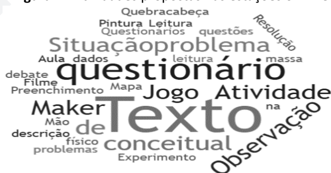
Figura 1 - Atividades propostas nas estações off-line.

Em relação às demais estações consideradas off-line, em que propõem atividades por meio de materiais físicos, foram desenvolvidas 9 diferentes propostas, sendo o material didático em forma de texto o mais utilizado, conforme mostra a nuvem de palavras na figura 1.