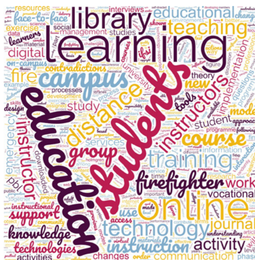
Figura 1: Nuvem de palavras elaborada a partir dos artigos selecionados.

Somado a isso, construiu-se uma nuvem de palavras, conforme pode ser visto na Figura 1.