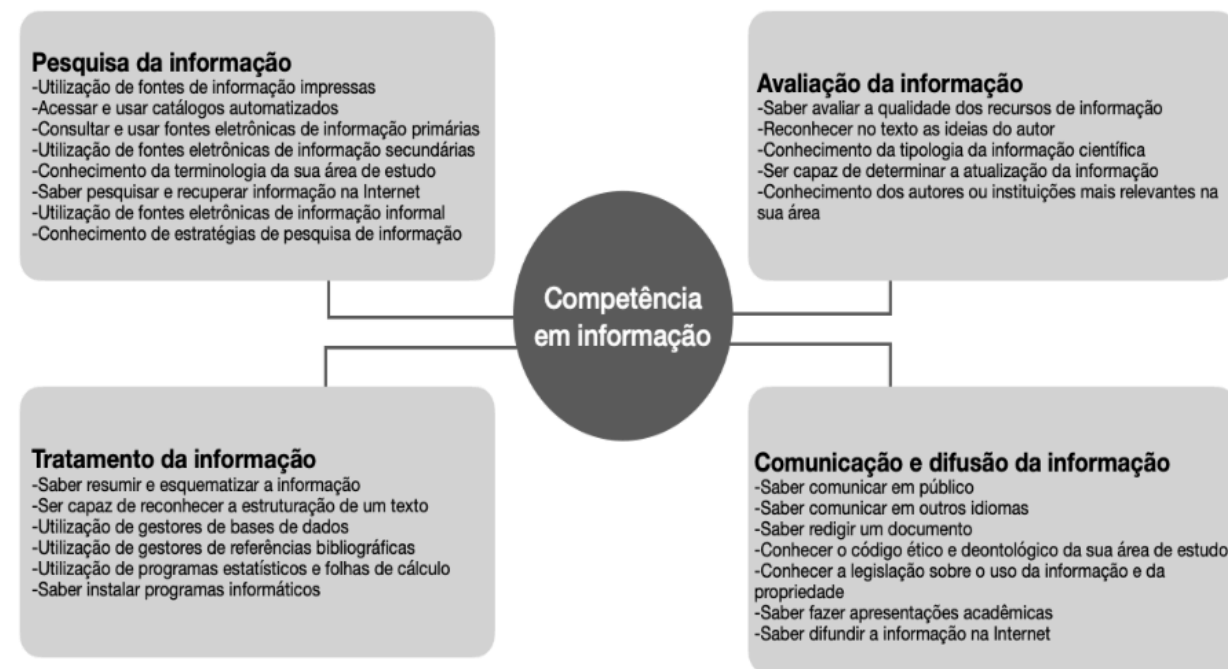
Figura 1 - Categorias de Competências em Informação

Ainda sobre competência em informação, é relevante apresentar, o modelo desenvolvido por Lopes e Pinto (2010), que estabelece categorias para mensuração da competência em informação (pesquisa, avaliação, processamento e comunicação e difusão da informação), possibilitando uma autoavaliação dos estudantes acerca das suas habilidades na gestão e uso da informação.