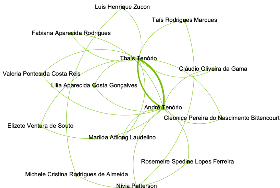
Figura 2 – Segunda maior comunidade coautoria.