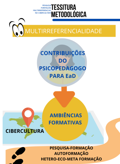
Imagem 1 - Tessitura Metodológica