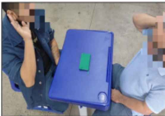
Figura 2 - fotografia do momento da aplicação do jogo

Diante do exposto, o autor Moran (2012, p. 111) salienta: “Aprendemos pelos jogos a conviver com regras e limites, explorando nossas possibilidades. Aprendemos, pelas brincadeiras, a encontrar variáveis e inovações com base em nossos objetivos ou em pessoas”.