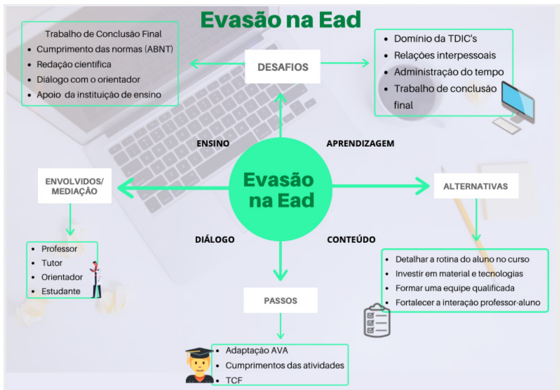
Figura 2. Mapa Mental do Grupo 7.