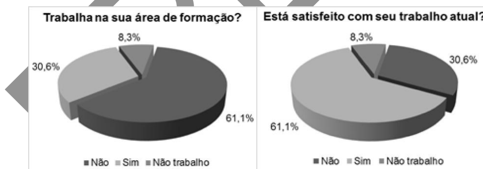
Figura 2. Percentuais em relação à atuação na área de formação e satisfação do trabalho atual dos egressos da UAB/Polo Cametá no ano de 2019.

De acordo com Antunes (2009), os sujeitos brasileiros que terminam seus estudos não mais têm garantido o seu espaço no mercado de trabalho, devido à subordinação do capital vigente. Diante disso, vimos que a maioria dos trabalhadores egressos (61,1%) não atua na sua área de formação, mas sim desempenham outras atividades laborais, como: vendedor, gerente, bancário, carteiro, atendente, secretário escolar, técnico em enfermagem, vigilante, autônomo e etc. Entretanto, mesmo que a maioria desses sujeitos não atue na sua área de formação, 61,1% também alegam estarem satisfeitos com sua profissão/ocupação atual. Na Figura 2 é possível visualizar as situações aqui descritas.