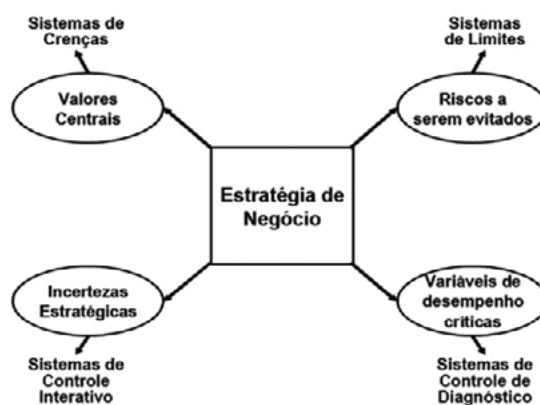
Figura 1: Sistema de Controle Estratégico

Dentro dessa perspectiva, temos as alavancas de controle proposta por Simons (1995), que desenvolveu um sistema de controle estratégico estruturado (Figura 1), no qual a construção da estratégia é estabelecido a partir de quatro vertentes: valores centrais, riscos a serem evitados, incertezas estratégicas e variáveis de desempenho críticas.